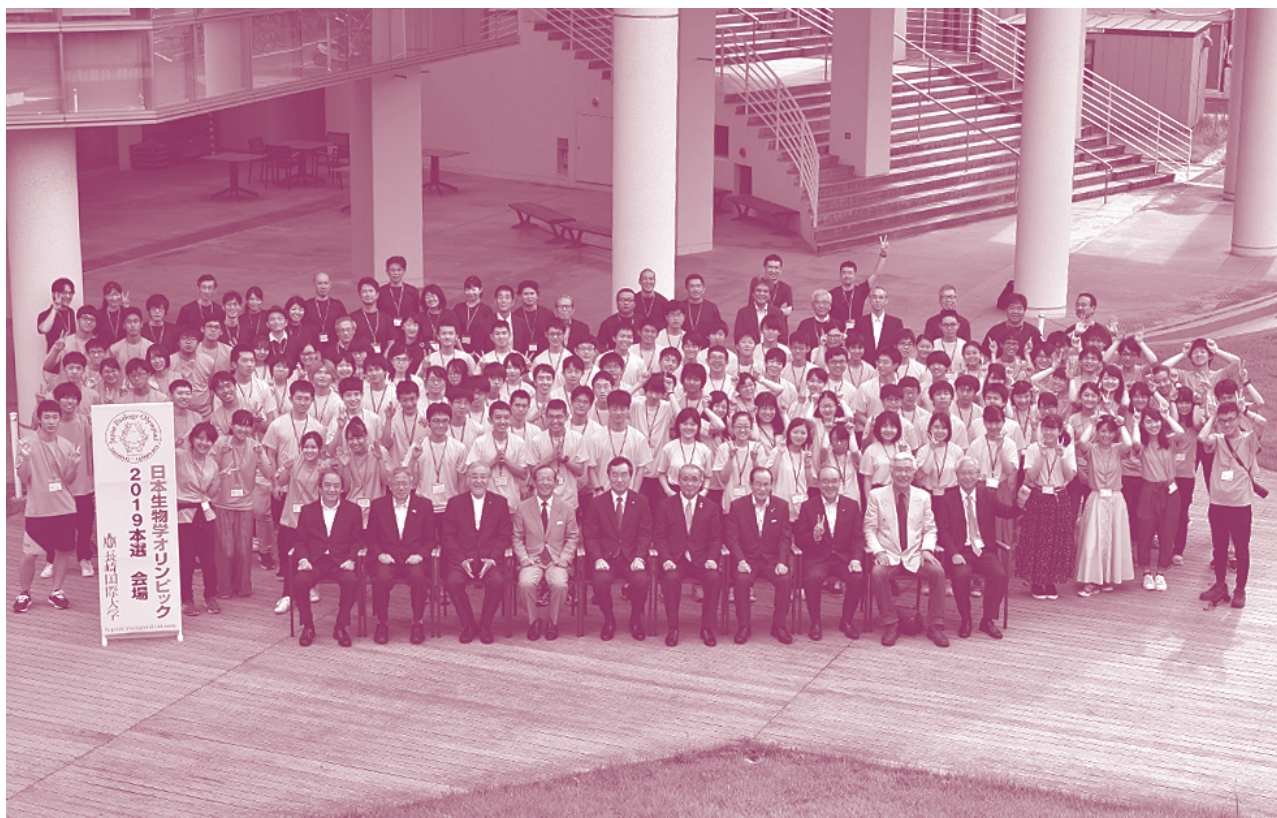
日本生物学オリンピック2019本選(2019年8月長崎国際大学)